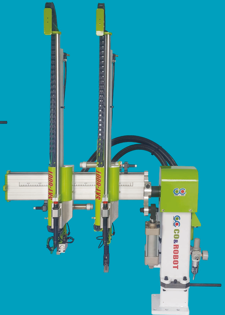
3단금형 대응(SKY-600T) For with three-plate mods